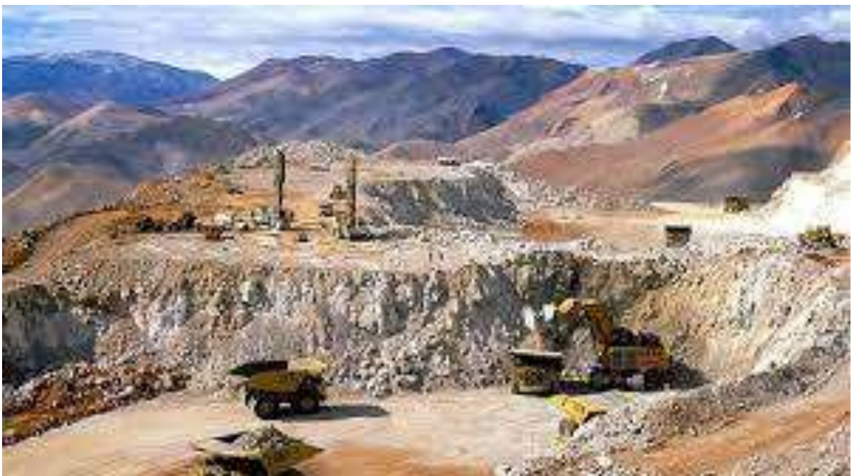
Foto ilustrativa de megaminería

Como parte de este cambio, si queremos tener más y mejor minería, es necesario hacer, y con el objetivo de colaborar, es necesario exponer una serie de conceptos, claves para entender la actividad minera profunda, y que se hizo mal, con el objetivo de cambiar y potenciar esta actividad, hoy necesaria, para colocar a la provincia como eje de la Argentina toda.