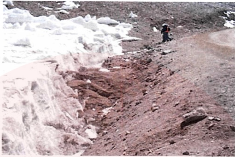
Sector del Glaciar Norte en su intersección con el camino

JUZGADO CRIMINAL Y CORRECCIONAL FEDERAL 7 - SECRETARIA N° 14 CFP 16156/2016