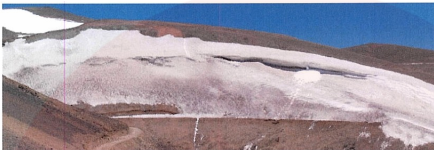
Glaciar Brown Inferior Desde Estación Fotográfica #1 (Dic. 8, 2003)

acumulación de polvo, acumulación de gravas del camino, alteraciones en los patrones de viento (...) El Glaciar Brown está actualmente separado en dos cuerpos de hielo”.